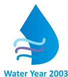
Water Year 2003

По инициативе Республики Таджикистан Генеральная Ассамблея ООН приняла следующие важные резолюции: