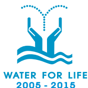
WATER FOR LIFE 2005 - 2015