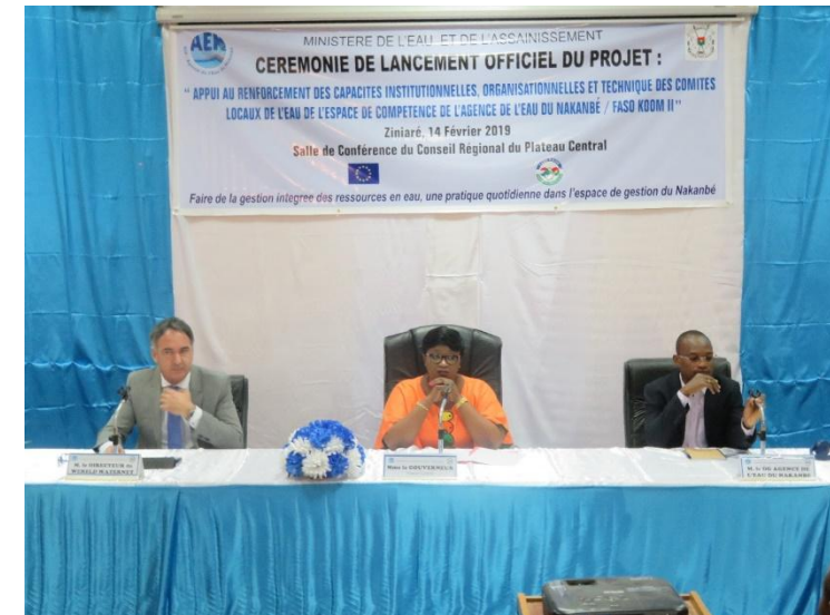
Photo de présidium à la cérémonie de lancement du projet FASOKOOM 2