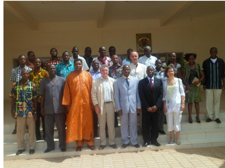
Photo de famille à l'issue du séminaire de lancement de la phase 1 – Mai 2012 à Ziniaré